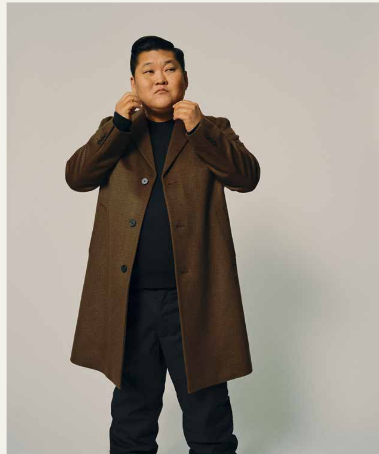
Frakke Uniqlo til 1.299 kr. Strik Uniqlo til 899 kr. Bukser Uniqlo til 349 kr.

flere tab. Han flygtede, fløj den halve verden væk og isolede sig totalt. Det gav ro til at samle tankerne. Men distancen forstærkede mere, end den dulmede.